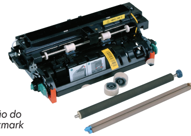
Kit de manutenção do fusor T65x da Lexmark

Em um teste recente, os fusores de todas as marcas de terceiros apresentaram falhas de desempenho. Os fusores originais da Lexmark não apresentaram falhas, fornecendo a qualidade, o desempenho e o valor de sempre.